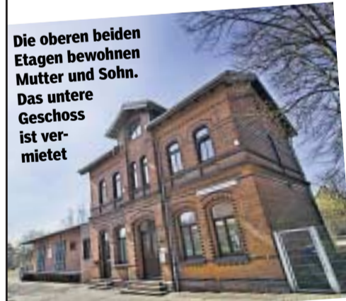
Die oberen beiden Etagen bewohnen Mutter und Sohn. Das untere Geschoss ist vermietet

Oder ist das Paradies am Wasser gebaut? Wir zeigen sieben Menschen, die ihren Traum bewohnen